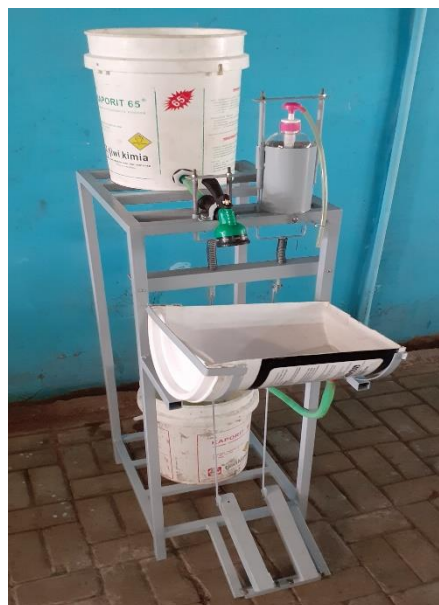
Gambar 4.2 Prototype alat bantu cuci tangan dengan pedal kaki

Alat bantu cuci tangan dengan pedal kaki selanjutnya diuji coba digunakan untuk melihat seberapa besar kelancaran keluarannya sabun dan air pada waktu pedal kaki diinjak/digunakan.